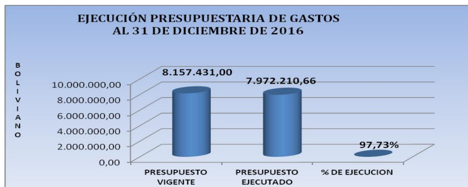
Cuadro Nº 4 EJECUCION DE LA DIRECCION ADMINISTRATIVA