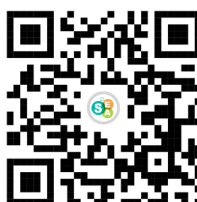
QR. 4 modelo de resolución en casos de AVP