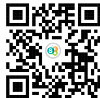
QR 2. Modelo de denuncia AVP

Una vez llenado el formulario, el mismo de manera inmediata o en un plazo no mayor a un (1) día hábil deberá ser puesto a conocimiento de la Comisión de Ética.